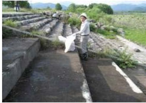
10月25日 湯川の一斉清掃 ボランティア活動風景