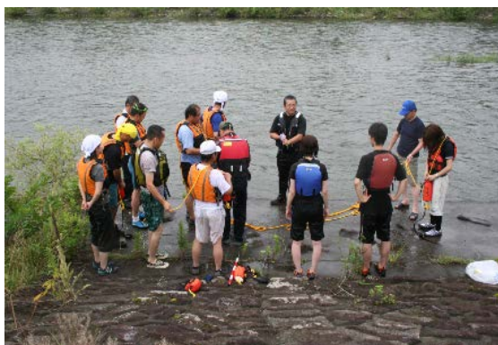
めだか塾・安全対策の実習