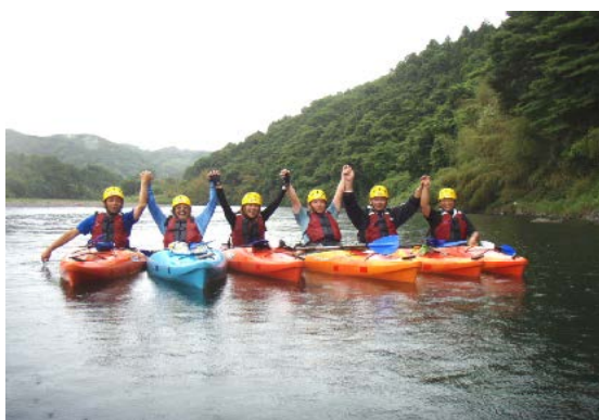
喜多方リバーツーリズムへの協力